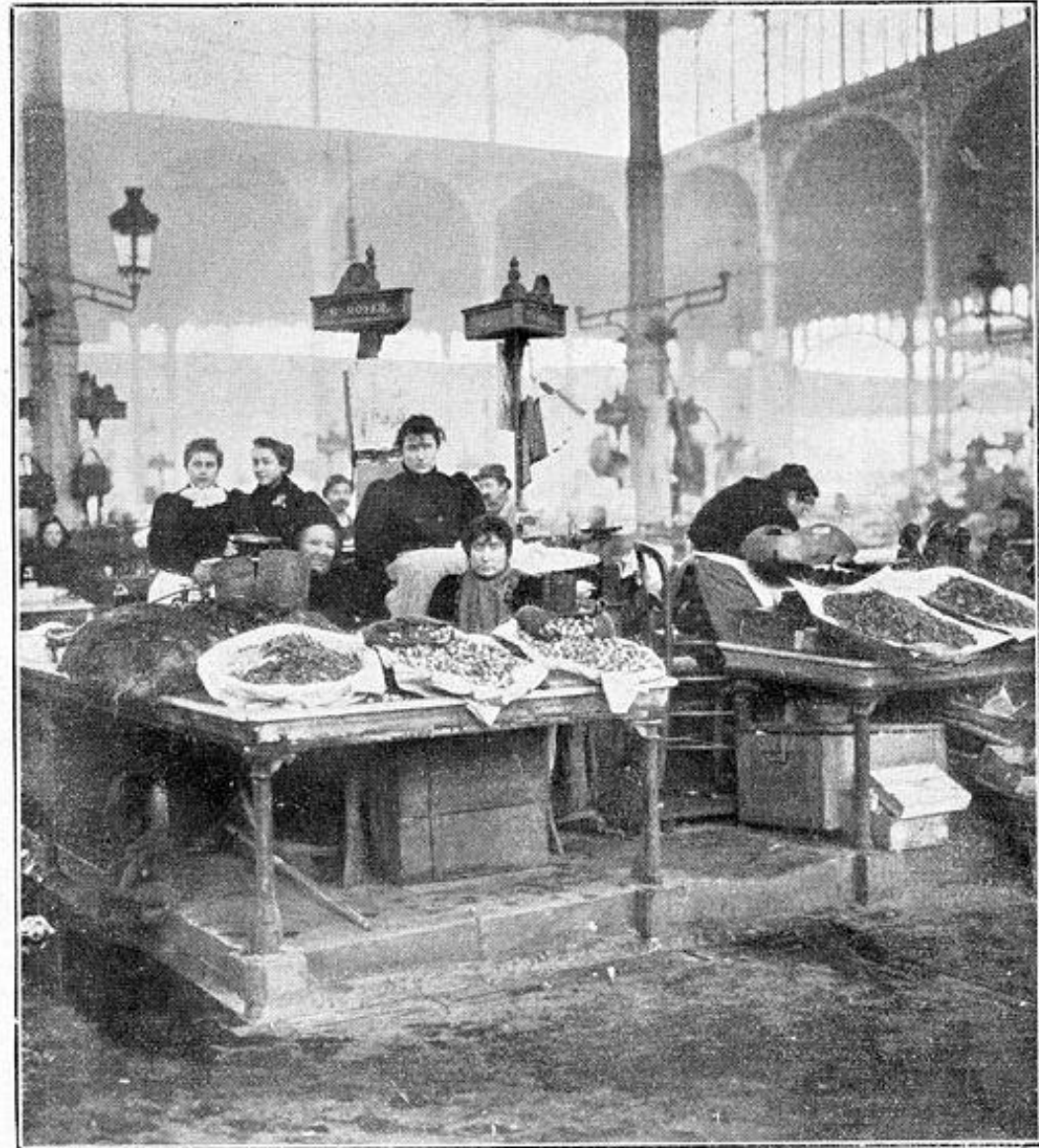
Les Halles : Pavillon de la marée.

Pavillon de la marée Clément Maurice 1897