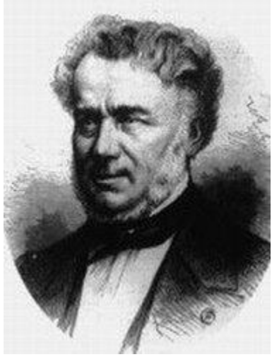
Victor Baltard 1805 - 1874

avec un ordre et une régularité inconnus aux marchés | des partisans s'il revenait par hasard parmi nous, et nous